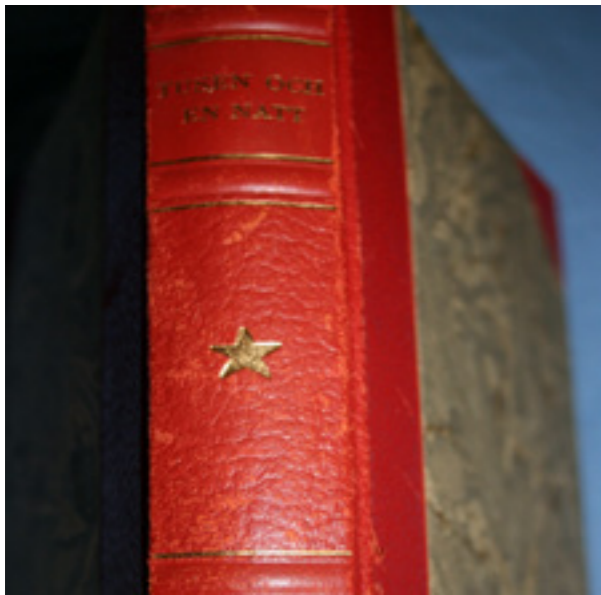
Illustrationer av Fernand Schultz Wettel ur boken Tusen och en Natt Arabiska Berättelser Andra Bandet Förlag J.Hasselgrens förlagsbokhandel Stockholm 1949