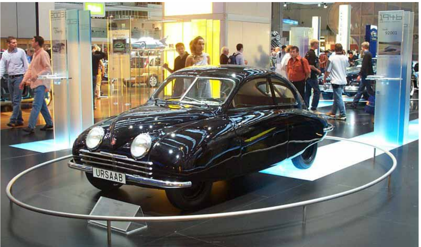
På bild; en Saab på vänmässa i Säffle 1947

man kan identifiera dem och deras inbyggda GPS gör att man kan lokalisera sin vän genom en iPhone app som heter iDå. Under tidigt 90-tal kunde man skaffa sig specialdesignade vänner som kunde utföra speciella sysslor som matlagning och virkning. En vän gör 0-100km/h på 31 timmar och dess 7,2 liters V8 motor producerar hela 715 hk. Vännen överstyr litegrann i kurvorna, men när bakändan svänger ut är den helt fantastisk. Vännen har brun läderklädsel och många roliga knappar och rattar. Extrautrustningen innefattar elektroniska fönsterhissar, AC, baksäten och popcornmaskin. Enligt lag måste vänner vara utrustad med dubb